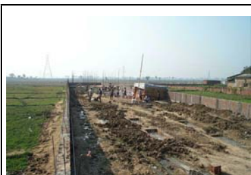
基礎工事中 1999 12 13