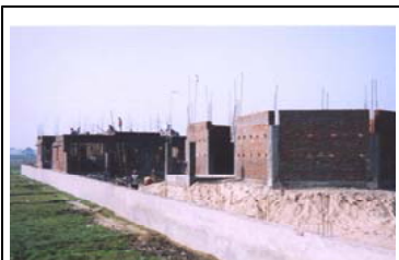
1F工事中 2000. 2 1