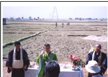
地鎮祭が行われる 1999 4 2